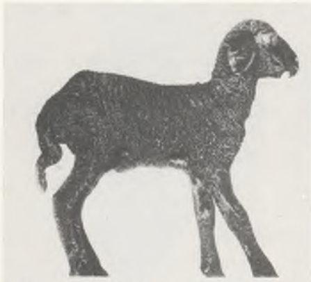
117 ♀ 114/80 Fena Vollblut