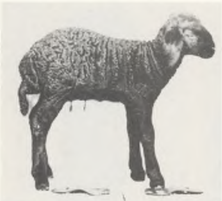
118 ♀ 102/80 FINKENKRIGII