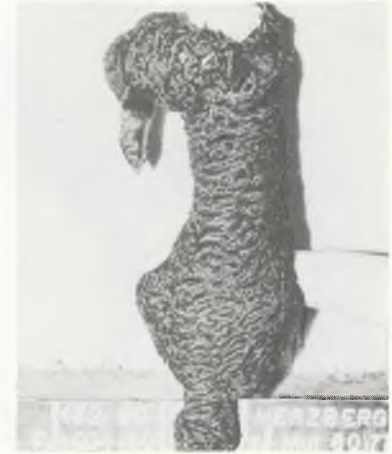
132/80-1315 HERZBERG fot-20-1-80 Schwarz Mut 80/77