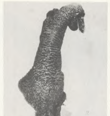
114 ♀ 80/80 Fena Vollblut