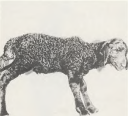
119 ♀ 102/80 FINKENKRIGII