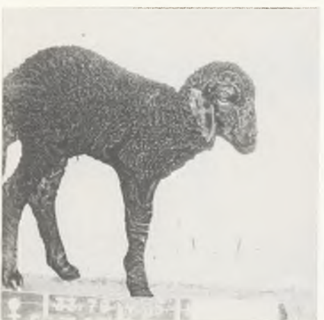
♀ 34.78-1015 Foh 5-1079 Schwarz Mut 55 1/2