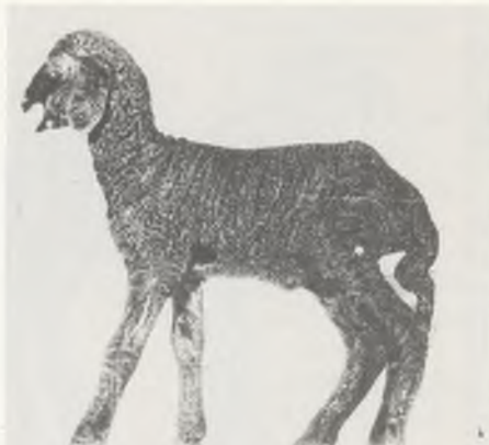
114 ♂ 80/80 Fena Vollblut