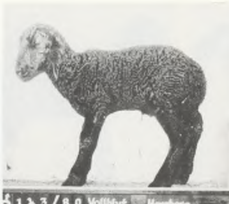
♂ 1 3 / 8 0 Vollblut Hensberg