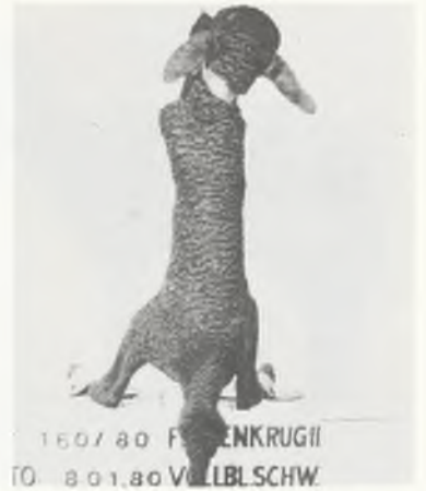
160/80 FINKENKRUGII TO 801,80 VILBLSCHW.