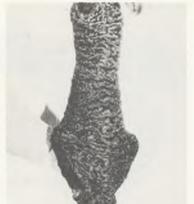
119 ♀ 102/80 FINKENKRIGII