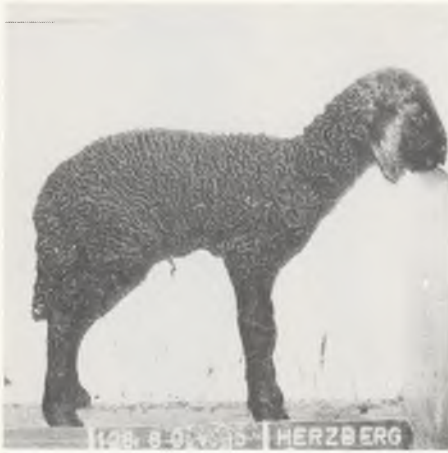
128 8 0 15 HERZBERG