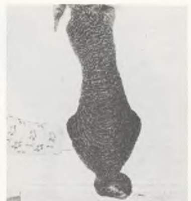
♂ 152 / 77 Horxl-002 Voll