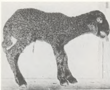
♂ 152 / 77 Horxl-002 Vollblut fol 20-1- 1977 schwarz