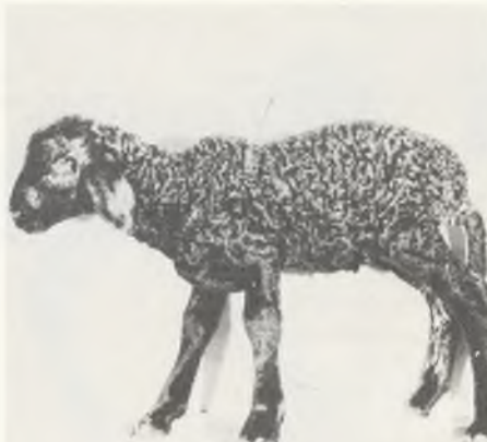
119 ♂ 102/80 FINKENKRIGII