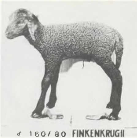
♂ 160/80 FINKENKRUGII