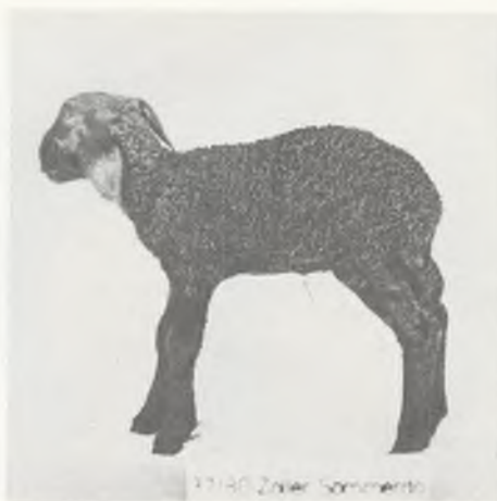
37/80 Züler Sommerda