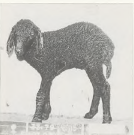
♀ 34.78-1015 Foh 5-1079 Schwarz Mut 55 1/2