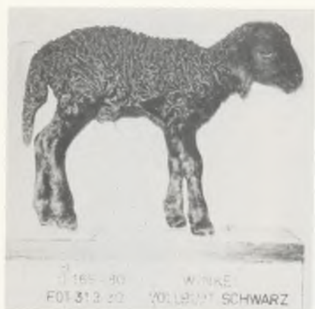
♂ 169-80 WINKE FOT.31.3.80 VOLLBLUT SCHWARZ