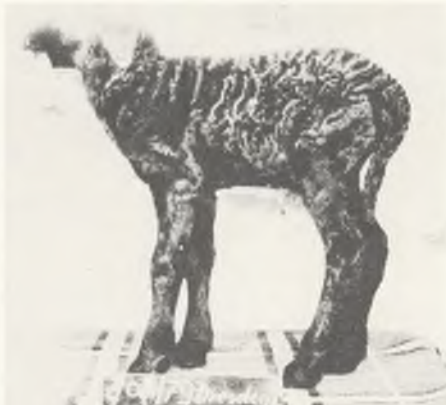
120 ♂ 102/80 FINKENKRIGII