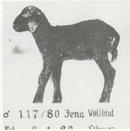
♂ 117/80 Jena Vollblut