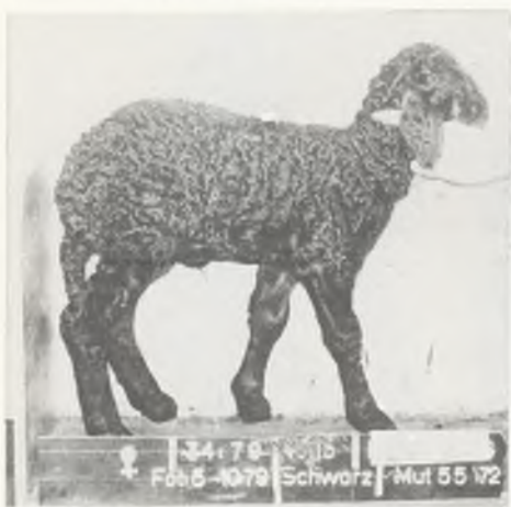
♀ 34.78-1015 Foh 5-1079 Schwarz Mut 55 1/2