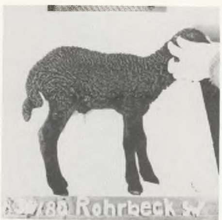
♂ 1780 Rohrbeck S