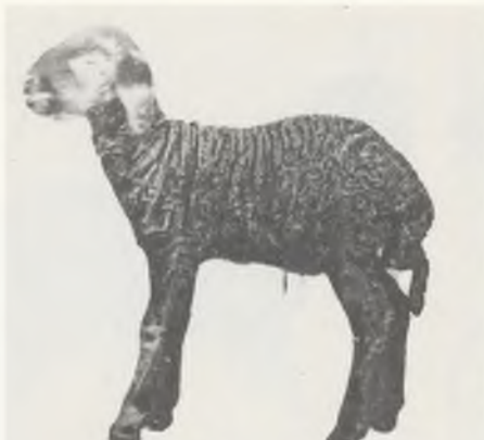
118 ♂ 102/80 FINKENKRIGII