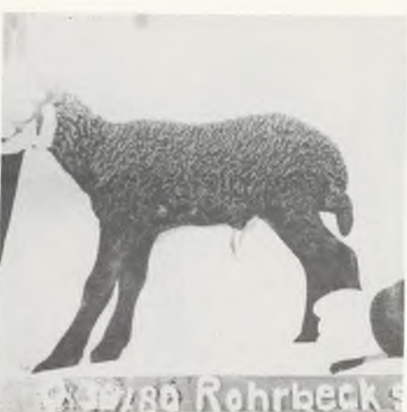
♂ 1780 Rohrbeck S