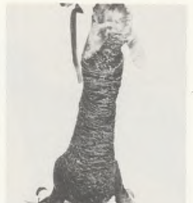
118 ♀ 102/80 FINKENKRIGII