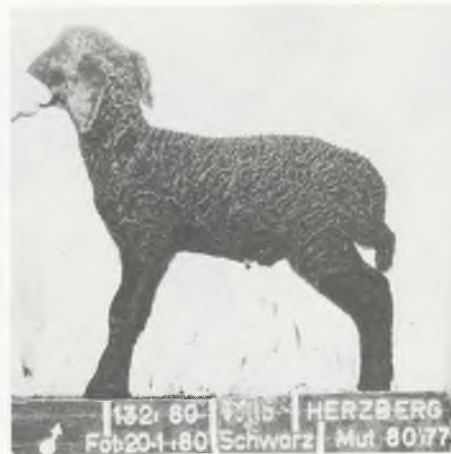
132/80-1315 HERZBERG fot-20-1-80 Schwarz Mut 80/77