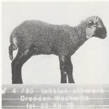
♂ 4/80 Vollblut-schwarz Dresden-Wachwitz fot-22 XII 79