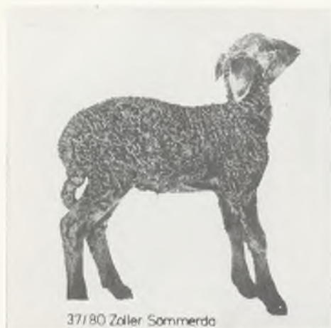
37/80 Züler Sommerda