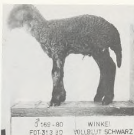
♂ 169-80 WINKE FOT.31.3.80 VOLLBLUT SCHWARZ