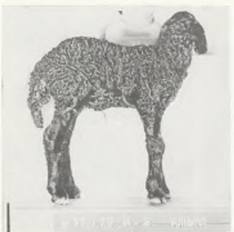
♀ 34.78-1015 Foh 5-1079 Schwarz Mut 55 1/2