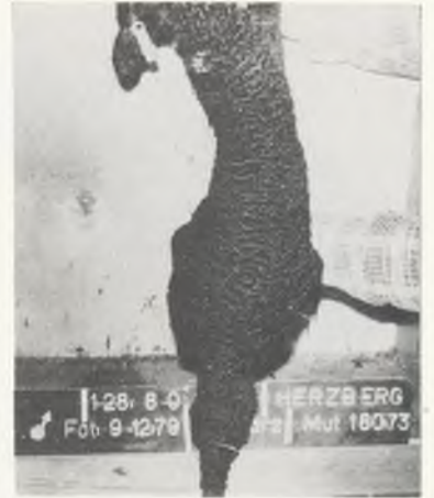
128 8 0 15 HERZBERG Fot. 9-1279 Mut. 18073