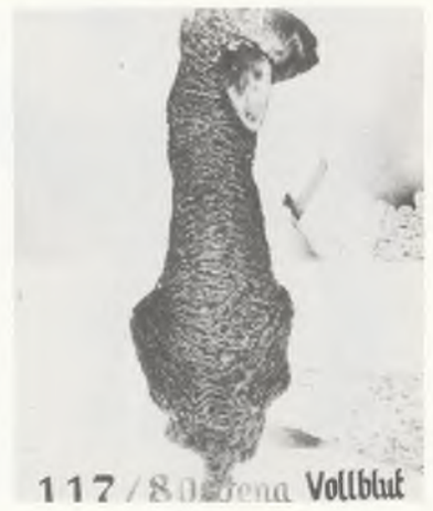
117/80 Jena Vollblut