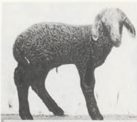
♂ 1 3 / 8 0 Vollblut Hensberg