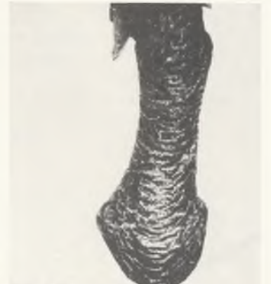
120 ♀ 102/80 FINKENKRIGII