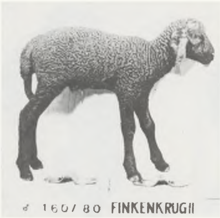
♂ 160/80 FINKENKRUGII