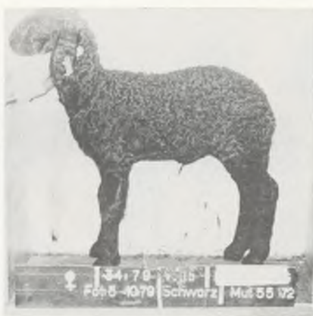
♀ 34.78-1015 Foh 5-1079 Schwarz Mut 55 1/2