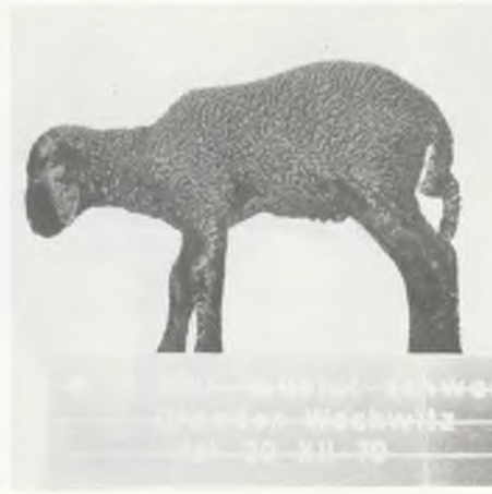
Vollblut-schwarz Dresden-Wachwitz fot-20 XII 79