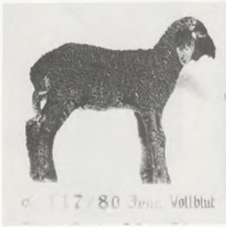
♂ 117/80 Jena Vollblut