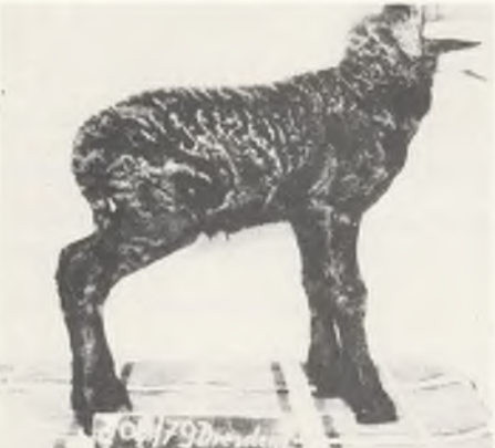
120 ♀ 102/80 FINKENKRIGII